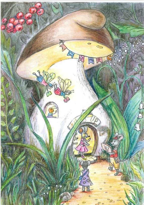
Zeichnung der Teilnehmerin / dessin de: Julia Tsybulskaysa

In Bezug auf die Didaktik und die Qualität des Unterrichts ist die Konsolidierung der Kursinhalte gemäss ihrer Gliederung in drei Stränge weiterverfolgt worden. Im Strang „Deutsch im ALLTAG“ wurde damit begonnen, das Lehrmaterial mit fide-Szenarien zu ergänzen, die von den Lehrkräften entwickelt wurden. Pour le module équivalent en français, une nouvelle méthode intitulée « Voyages » a été choisie et une formation continue interne organisée pour son introduction. De plus, les tests d'évaluation de niveau de langue du français ont été adaptés aux nouveaux supports de cours « Inspire ». Des tests écrits d'évaluation de niveau, proposés à la moitié du trimestre pour contrôler