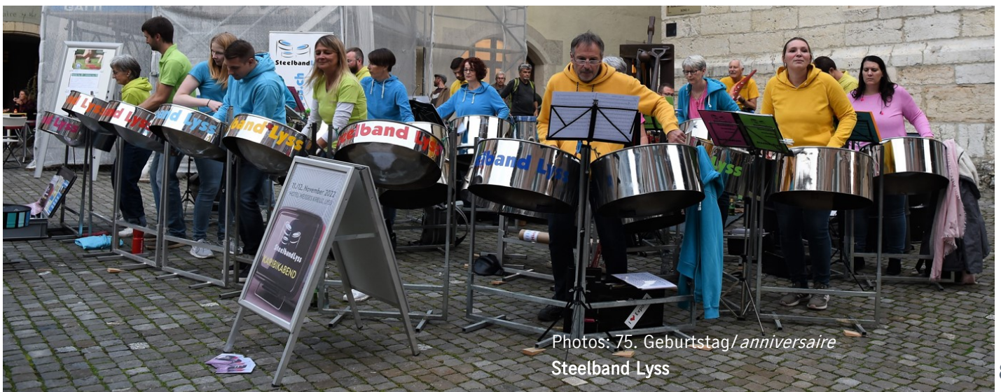
Photos: 75. Geburtstag / anniversaire Steelband Lyss

Organisiert wird das Angebot der VHS Region Biel-Lyss von der siebenköpfigen Geschäftsstelle. Der Pool der Kursleitenden umfasst rund 120 Personen. Die VHS Region Biel-Lyss ist vom Schweizerischen Verband für Weiterbildung («eduQua») zertifiziert und hat kürzlich zum vierten Mal das Label für die Zweisprachigkeit des Forums für die Zweisprachigkeit erhalten.